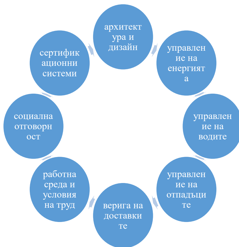
Фигура 1 Направления на устойчивото хотелиерство, според дефинициите на институционални организации и научни изследователи