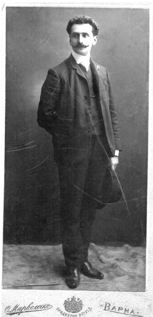
Фиг.1 Арх. Дабко Дабков

след което се дипломира като архитект през 1899 г. от Техническият университет в Мюнхен, Германия. Още същата година се завръща в България и се установява във Варна, където прекарва и остатък от живота си в творчество, което ние, съвременните варненци имаме като безценно наследство. Арх. Дабков реализира приблизително 350 обекта само във Варна. Сред образците на сецесионовия му период трябва да се посочат следните сгради – гранд хотел „Лондон”, построен в периода 1906-1912 г., Аквариумът, изграден в годините между 1906-1911 г. и открит през 1932 г., хотелите „България” и „Борис” на ул. „Цариброд”, Турската баня на Шукрю бей (1912-1914 г.), домовете на