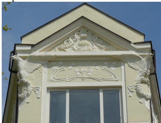
Фиг. 7 Детайл от банка „Напредък”, 1908 г., инж. Георги Бърнев

европейското начало и съвсем спокойно може да се каже, че към началото на ХХІ в., ние, съвременните варненци, обръщайки поглед назад към миналото ще установим само, че нашите славни предходници принадлежат към една вече изгубена цивилизация, която ние сами сме захвърлили в прегръдката на забравата. А що се касае до сецесиона, с всяка година той отслабва своето присъствие във Варна.