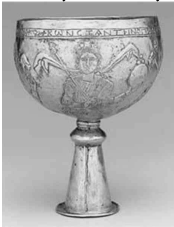
Златна чаша от съкровището на кан Кубер, намерено край Албанското с. Врап. Части от него са в Метрополитен музей в САЩ и в археологическия музей на Истанбул

4. Съкровището на Кан Кубер, намерено край албанското село Врап. Поделено е между музея „Метрополитен“ САЩ и Археологическия музей в Истанбул.