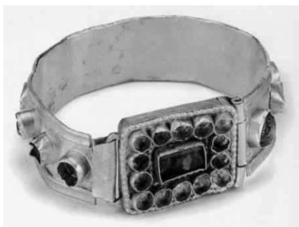
Гривна – част от съкровището на кан Кубрат, открито край с. Малая Перешчепина, Украйна. То е най-голямото в ранното Средновековие. Съдържа над 800 предмета. Намира се в Ермитажа.

Тези български съкровища са в състояние да опровергават думите на Ст. Цанев, защото са съхранили блясъка и величието на българската държава във времето и са извор на самочувствието и на националната ни гордост от славното минало на Отечеството ни.